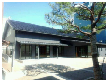
ホール前広場(受付場所)