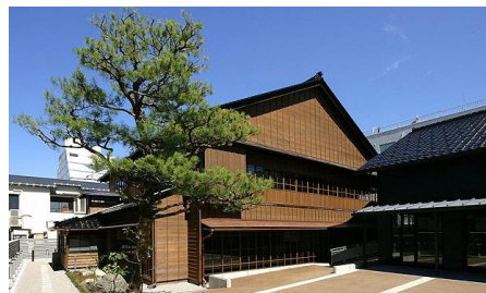
会場：金沢学生のまち市民交流館